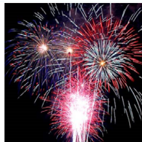
Foto // Danza, musica e fuochi: domenica 5, uno spettacolo per il Salone Nautico in piazza De Ferrari